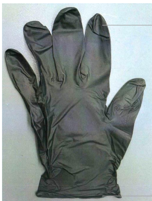
Couleur : Noir

Taille du carton : 31x23x22cm CBM : 0,02